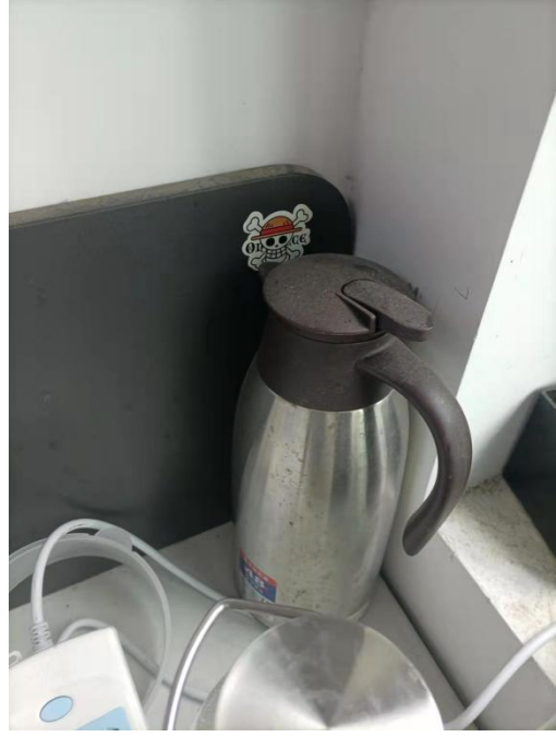
存在乱拉网线和电线现象