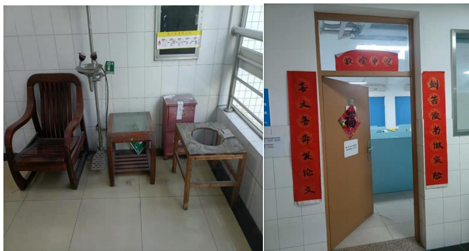
存在不规整和不规范的现象

学院领导班子成员将按照《关于建立中药学院领导班子成员实验室安全巡查制度的通知》（中药[2021]184号）文的要求，定期对学院全部实验室、研究生休息室进行安全巡查，对发现问题将及时通知整改，对存在安全隐患但不整改或整改不到位的实验室或研究生休息室，学院将按规定给予通报批评，并按学校规定对相关负责老师和研究生进行约谈并上报学校有关部门。